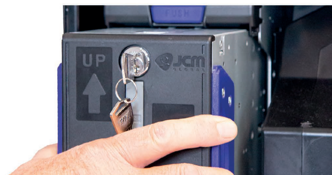
Riciclatore banconote asportabile